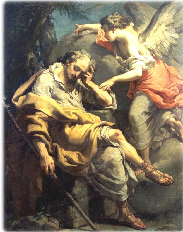
Il sogno di Giuseppe di Gaetano Gandolfi (1704-1802)

Ci siamo quasi, sta per nascere, è l’inizio. È l’ini-zio di un nuovo modo di abitare la vita, di un Dio che sceglie la via del grembo, del silenzio, del sogno. Un Dio che non si impone, ma si espone; che non conquista, ma si consegna. Il Vangelo di oggi ci accompagna a ca-pire il modo in cui Dio entra nella storia, in un mondo di silenzio, di so-gno: nel grembo di una donna e nel cuore di un uomo. In quel cuore di Giuseppe che si fa an-ch’esso culla accogliente. No, Dio non irrompe con potenza, non squarcia i cieli con fragore, ma si fa spazio nella fragilità, nel dubbio, nel silenzio, nella